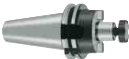
Aufnahmedorn bis D 40 Holding arbor up to D 40 Mandrin jusqu'à D 40

Tolérance de concentricité du cône extérieur par rapport au tenon de serrage d_1 = 0,01 mm