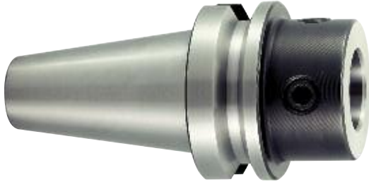
Grundaufnahme mit MVS Master shank with MVS Module de base avec MVS