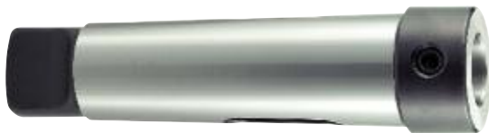
DIN 228 A / 2207